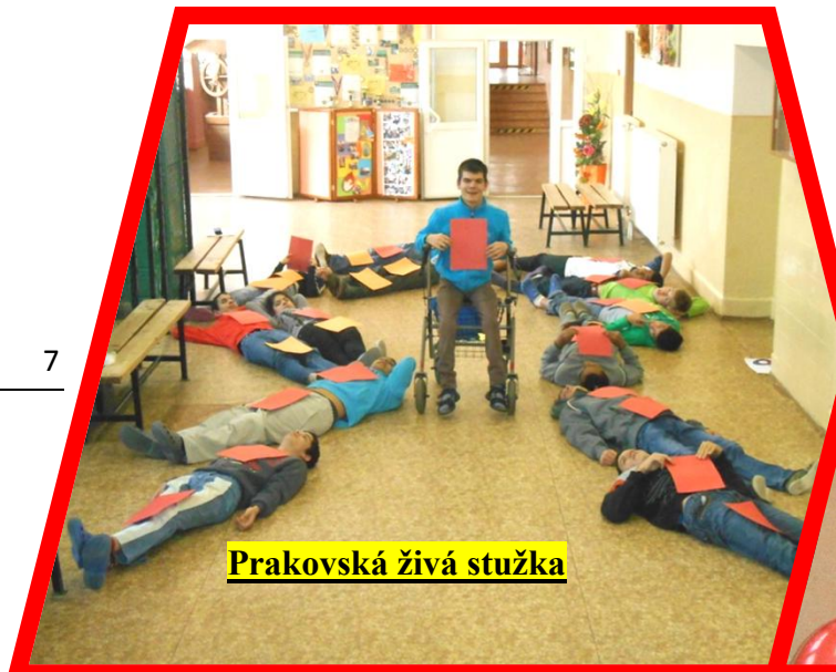
Prakovská živá stužka